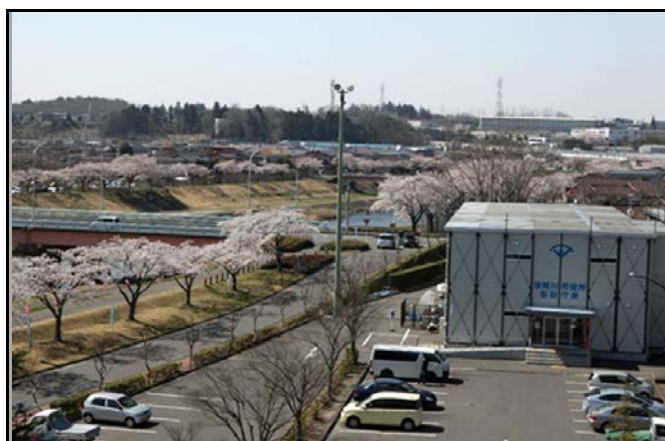
須賀川市役所仮設庁舎