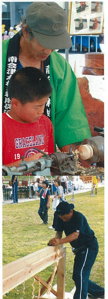
(上写真) コマづくりの様子。うまく削れるかな？ (下写真) カンナけずりコンテストの様子。

19日には、この時期のもう一つの森の恵み「きのこ」をふんだんに使った「きのこ汁」のふるまいも行いました。用意した300人分が1時間足らずでなくなるなど、こちらも皆様に喜んでいただけました。