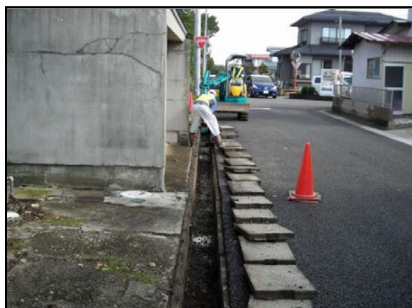
仁井田地区内側溝除染作業