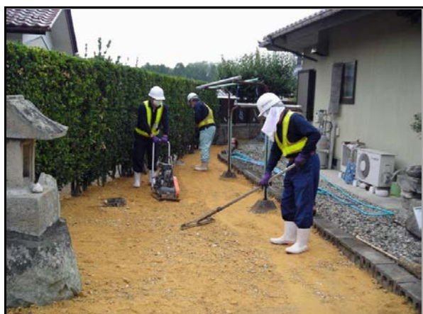
仁井田地区内住宅除染作業