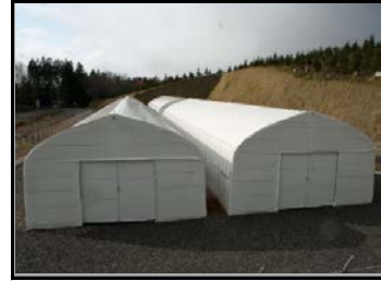
仮置場（裏側から撮影）