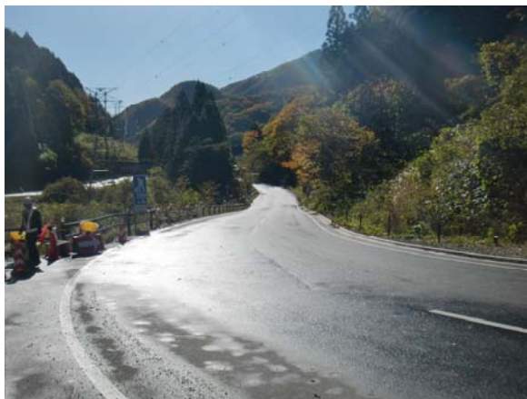
道幅が狭い現在の道路