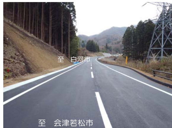
部分開通区間の状況