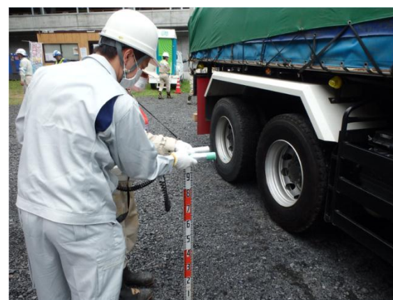
運搬車両の空間線量率の測定