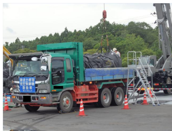
除去土壌の積下ろし作業