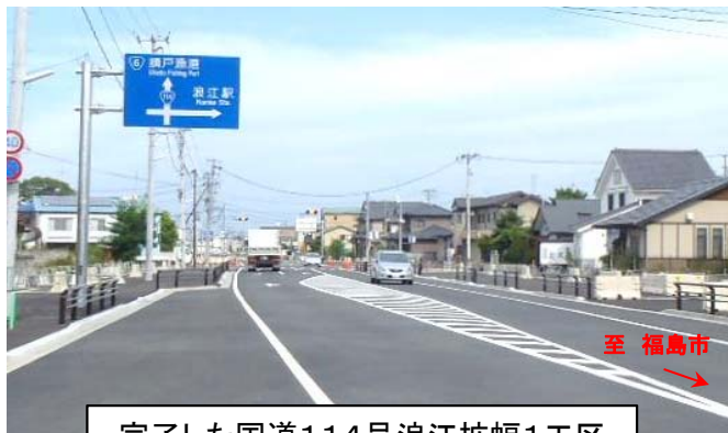
完了した国道114号浪江拡幅1工区

国道114号は地域の方々が帰還する上で重要なインフラであるため、連続する浪江拡幅2工区(460m)についても平成27年度に事業着手しており、今後、一日も早い完了を目指してまいります。