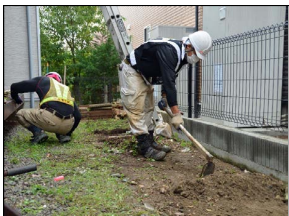
住宅除染での表土の剥ぎ取り作業