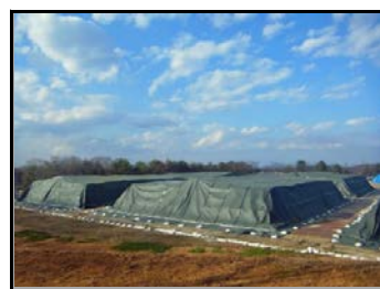
陸上競技場仮置場