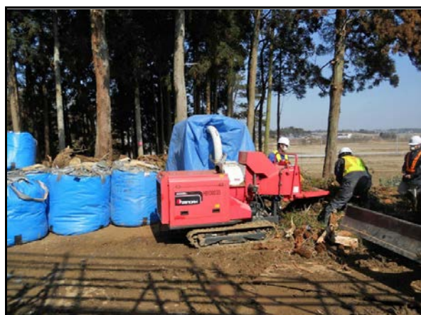
枝打ち後の破碎及び袋詰め