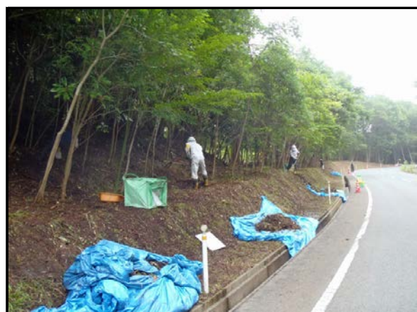
道路路肩除染作業 (H25当時)