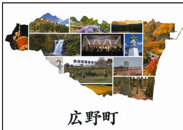
広野町ガイドマップ表紙