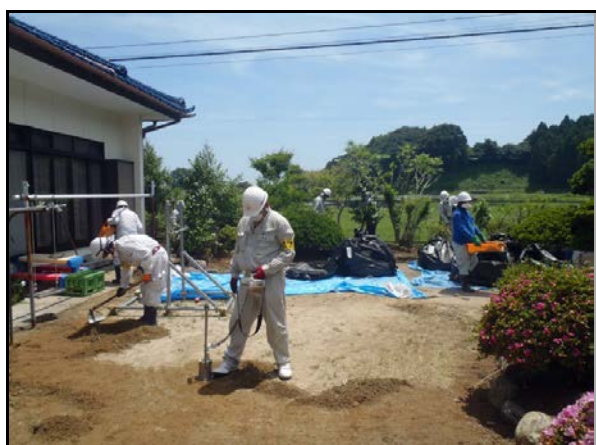
家屋除染作業 (H24当時)