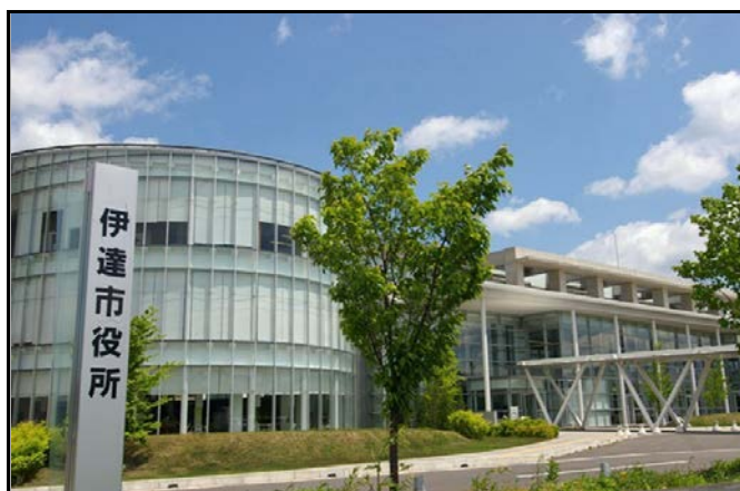
伊達市役所 保原庁舎