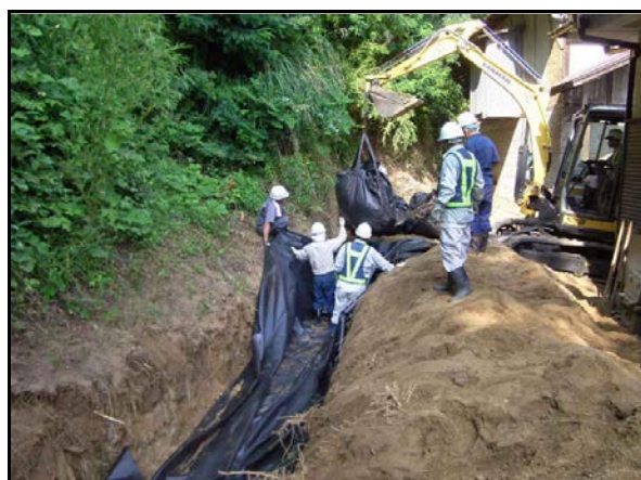
フレコン埋設作業