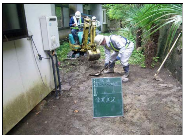
表土剥ぎ取り作業