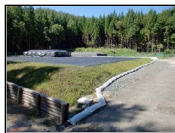
手前: 2号(不燃物)置場 奥: 3号(可燃)置場