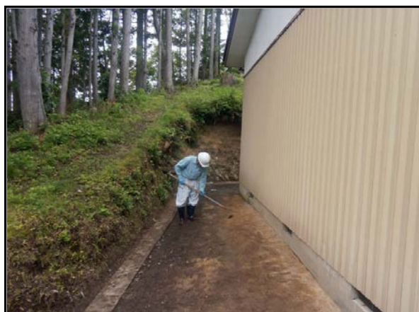
表土剥ぎ取り(人力)