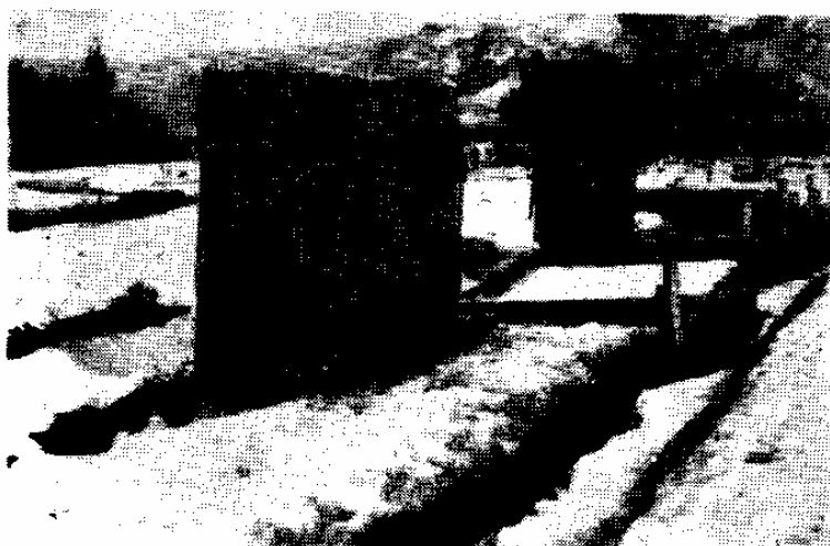
手前 防風垣A区 後方 防風垣B区