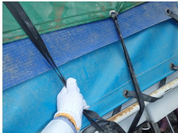
荷台シートの確認