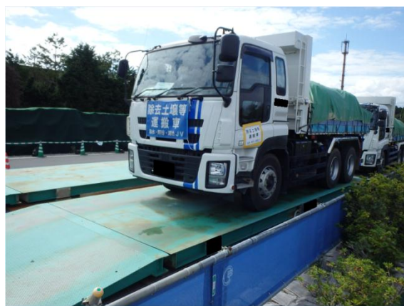
輸送車両の重量測定機器の確認