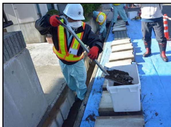
道路除染での側溝堆積物の除去作業