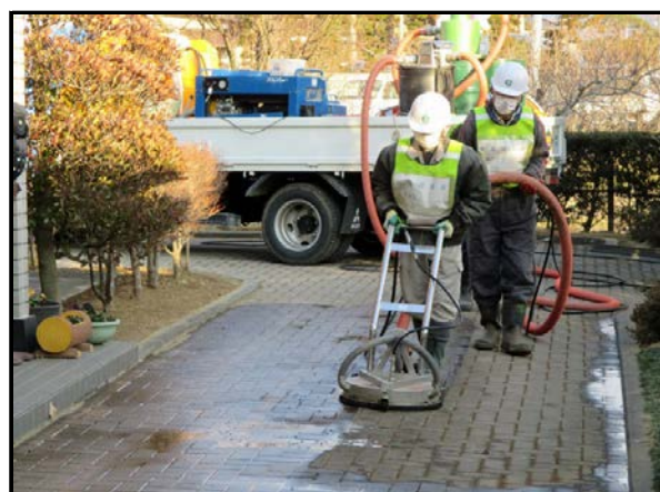
回収型高圧洗浄機による作業