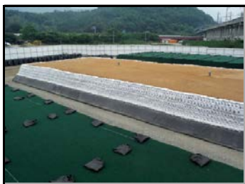
土のうで遮へいし、 遮水シートで覆う前の状況