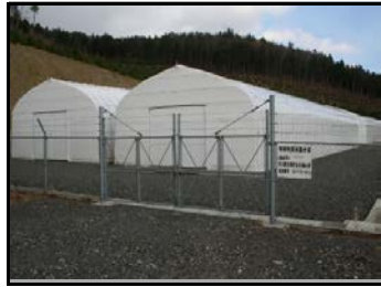
仮置場（入り口側から撮影）