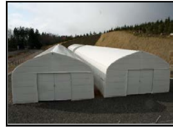
仮置場（裏側から撮影）