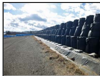
仮置場での保管の様子