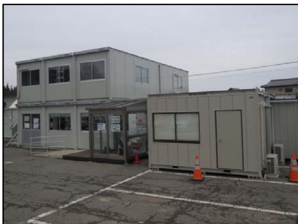
西郷村放射能対策課事務室