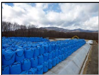
仮置場造成の様子