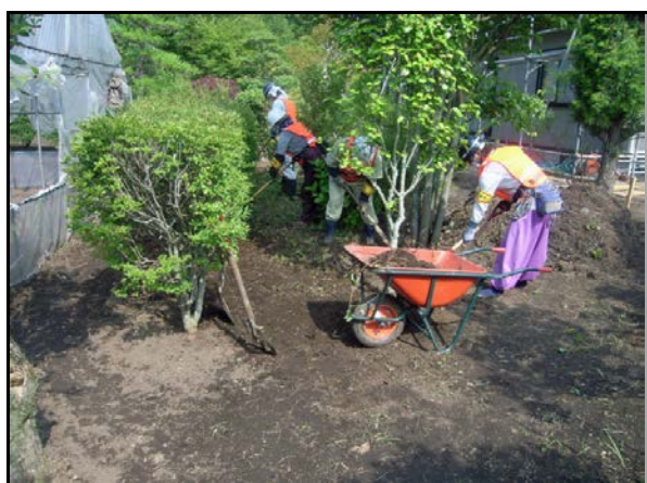
汚染土壌剥ぎ取り作業