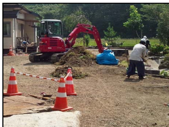
住宅敷地内の除染作業