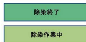
住宅除染進捗図(平成27年9月末時点)