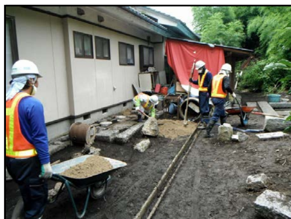
住宅除染実施状況