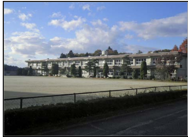
除染現場 (山白石小学校)