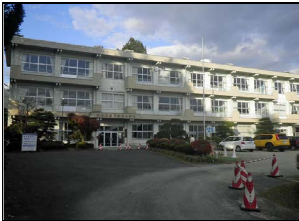
除染現場 (里白石小学校)