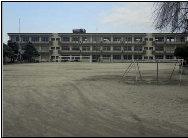
除染現場 (浅川小学校)