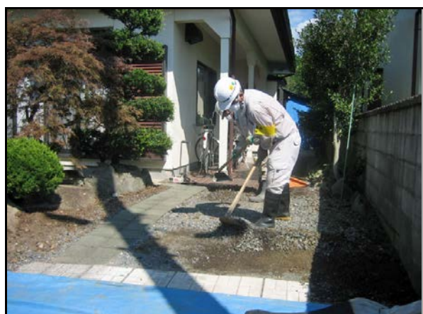
砂利・碎石の除去