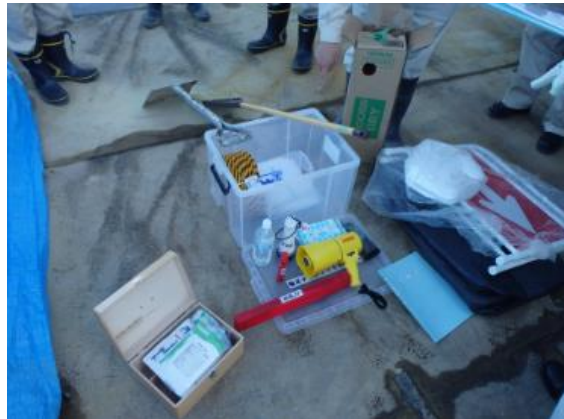
携行品（事故発生時に使用する器具等） の確認