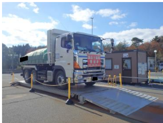
輸送車両の重量測定状況の確認