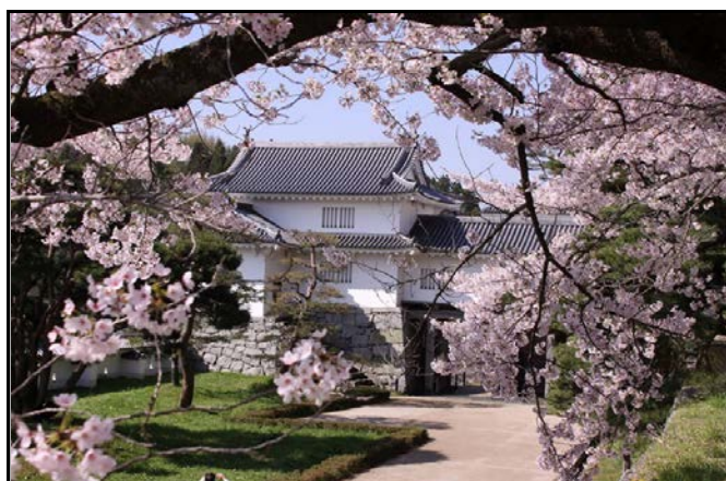
霞ヶ城公園 箕輪門