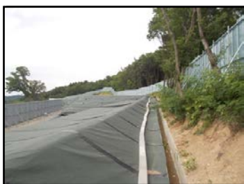
郡山市日和田町高倉地内の 仮置場