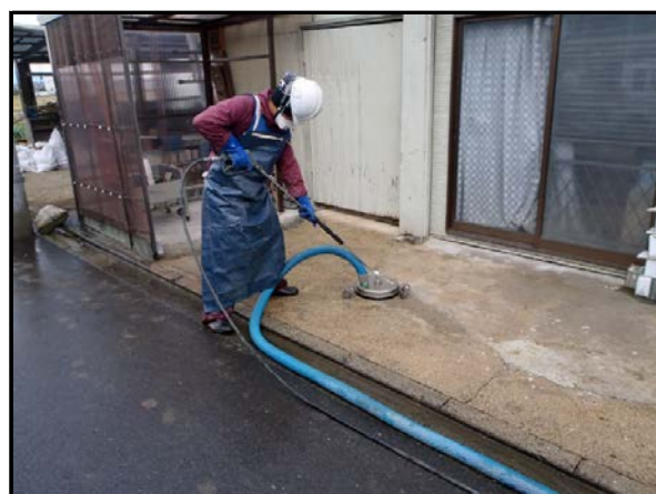
吸引型高圧洗浄によるコンクリートたたき等の除染作業