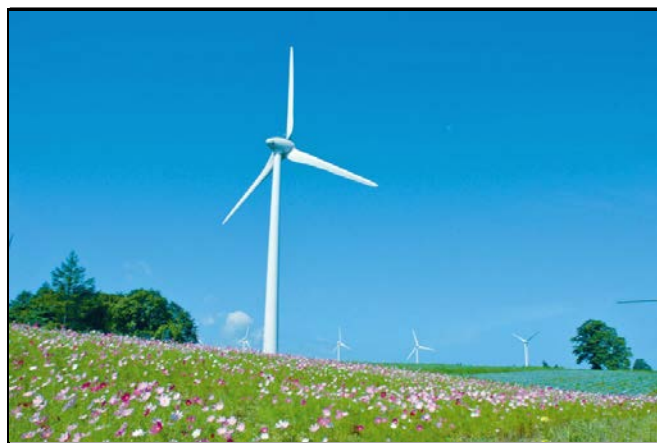
郡山布引風の高原

(解説) 郡山市湖南町にある布引高原は、33基の風力発電用風車が立ち並び、磐梯山や猪苗代湖が一望できる風と緑があふれる観光スポットである。