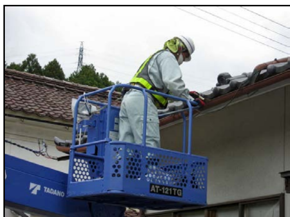
雨樋(横樋の堆積物の除去・拭き取り)の除染作業