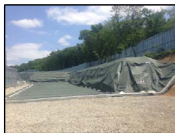
郡山市日和田町高倉地内の 仮置場