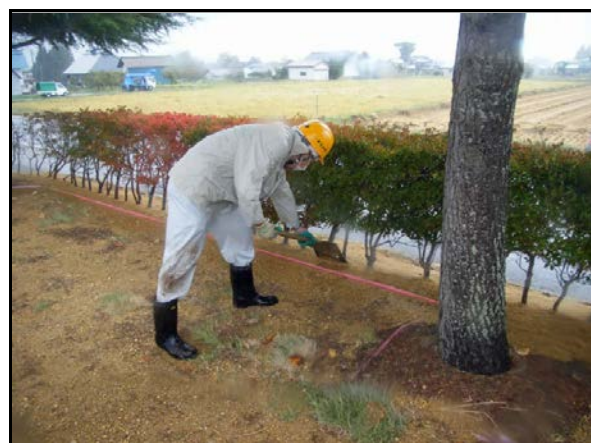
役場周辺除染(客土)