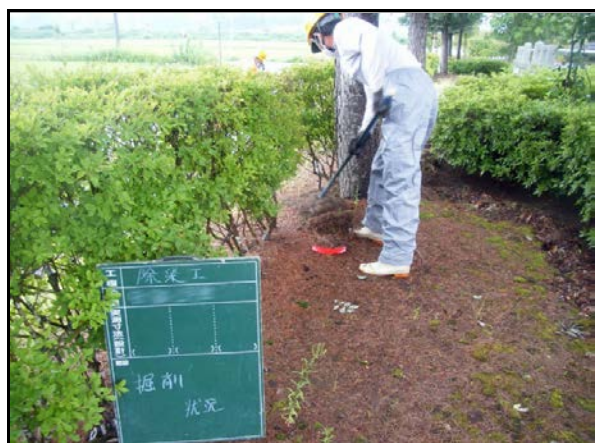
役場周辺除染(表土の剥ぎ取り)