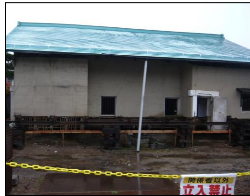
旧脇本陣柳屋旅館工事

【このニュースに関するお問い合わせはこちらへお願いします】 福島県県南建設事務所 企画管理部 企画調査課 (TEL: 0248-23-1617) 白河市役所 建設部 都市政策室 まちづくり推進課 (TEL: 0248-22-1111)