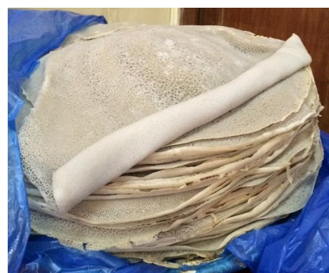
これは何でしょう。

そして、エチオピア人の大好きなバルバレと呼ばれる香辛料がたっぷり。ピリ辛ですが、ヴァリエーションも豊富です。エチオピアの人々は仲良しの印にお互いにこれを食べさせあう習慣があるのでよ。