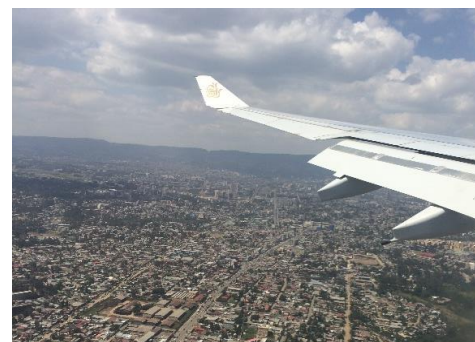
エチオピアの首都アディスアベバにまもなく到着。標高2000m越えの所ですが、建物がたくさんあります。

そんなエチオピアですが、ちょっと不思議。それは、エチオピア暦という独自の暦が使われていること。また、エチオピア時間というものもあります。さらに、アムハラ語という言葉を使っています。「この国にしかない!」というものを大切にしている国です。それぞれについてはまた、詳しくレポートしていこうと思います。