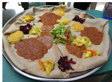
上に乗っているのがワット。これで3～4人前です。