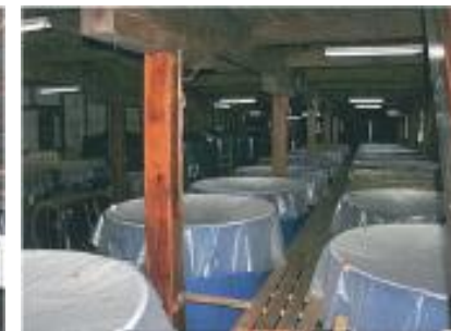
【千駒酒造の蔵内部】