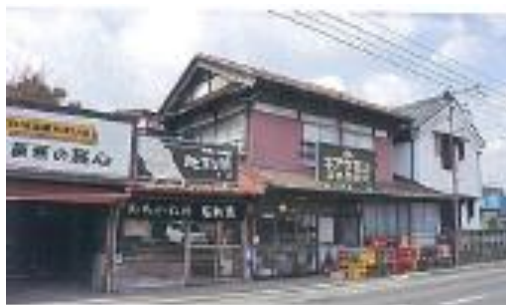
【紙屋醸造建造物群（桜町）】