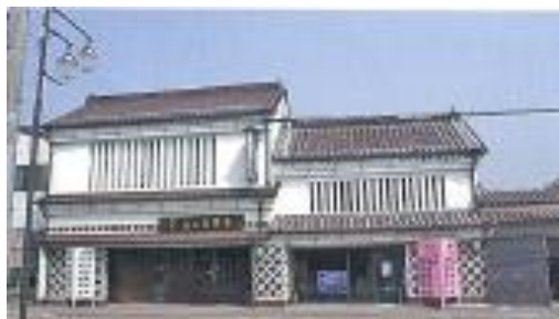
【上の片野屋建造物群（桜町）】