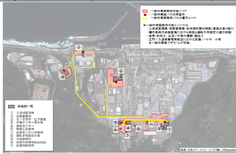
一般作業服着用可能エリア