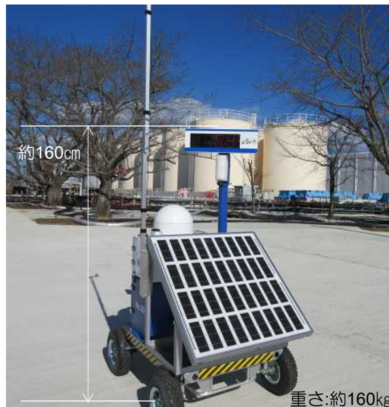
線量率モニタ 外観写真