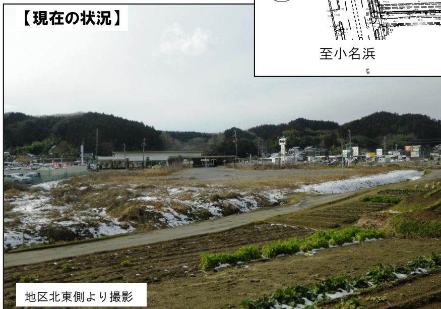
地区北東側より撮影