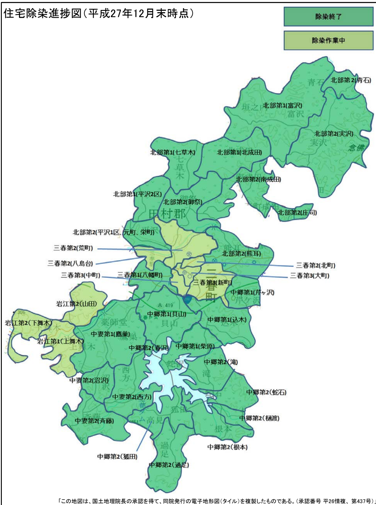
住宅除染進捗図(平成27年12月末時点)