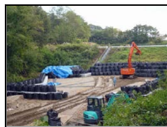
周辺を遮へい土のうで覆い、除去土壌等を据付