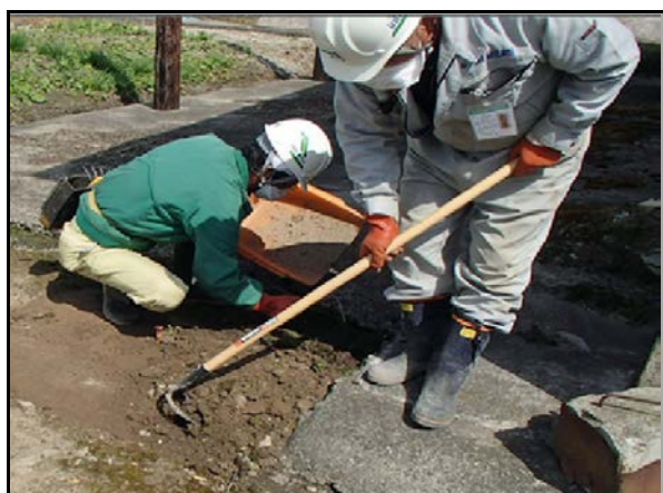
土壌剥ぎ取り作業