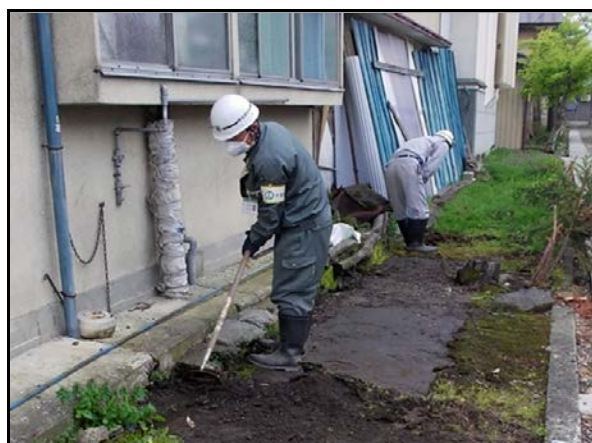
土壌剥ぎ取り作業