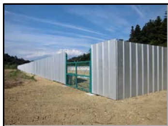
仮置場での遮へい作業