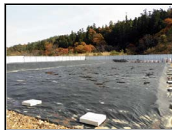
完成された仮置場