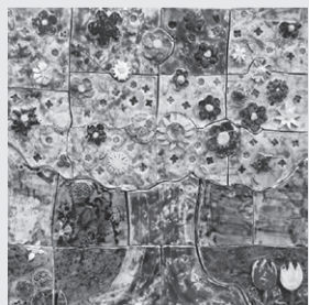
アートの力 「花」未来のわたしたち

4月に開校したふたば未来学園高等学校で、平成27年11月3日に、双来祭(未来創造ゼミ)学習発表会が開催されました。未来創造ゼミ(ふたば)の教育復興応援団による授業において、生徒たちは地域の課題を乗り越えようと挑戦し、「ドラマの力」「祭りの力」「アートの力」「スポーツの力」の4つのワーキンググループに分かれて作品を制作しました。当日はそれぞれの作品が披露され、先進的な学びの成果として地域に発信されました。