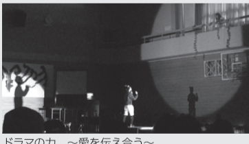
ドラマの力 ～愛を伝え合う～