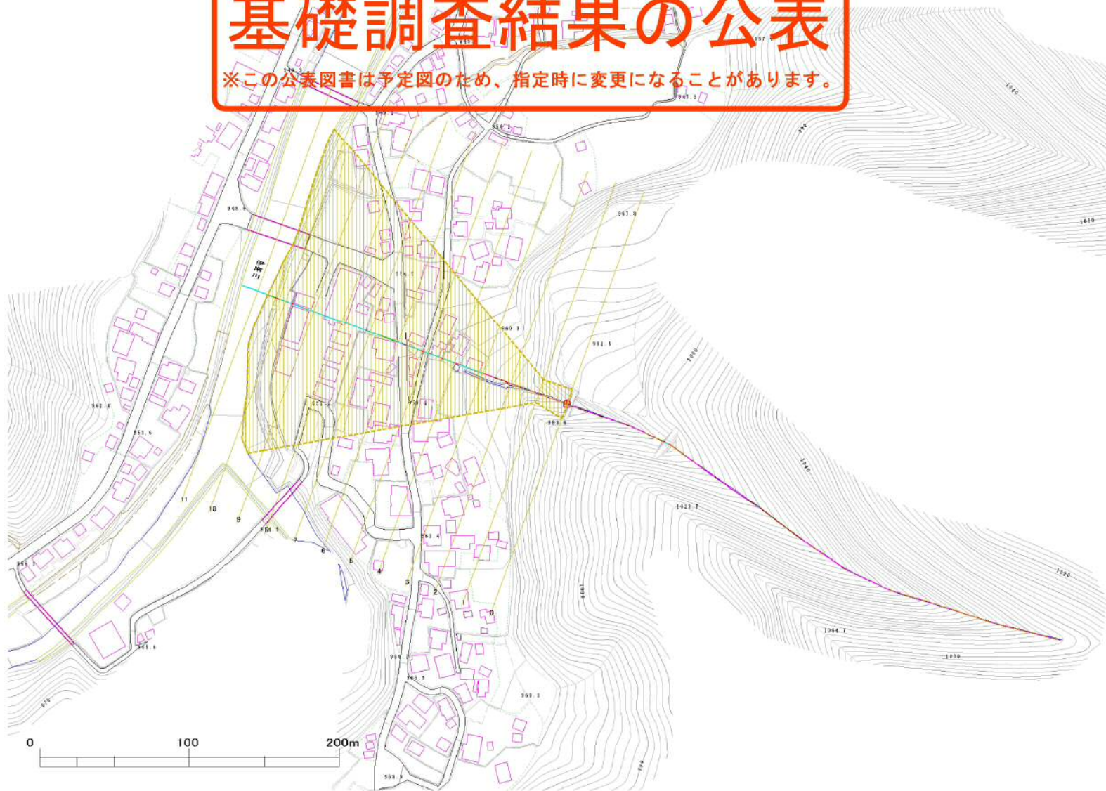
様式-2(土) 土砂災害警戒区域・土砂災害特別警戒区域 区域図

土砂災害警戒区域 (土砂災害防止法施行令第二条の基準に該当する区域) 土砂災害特別警戒区域 (土砂災害防止法施行令第三条の基準に該当する区域) 土砂等の高さが1mを超え、その衝撃力が50kN/mwを超える区域 土砂等の高さが1mを超え、その衝撃力が50kN/mwを超えない区域 上記以外の区域