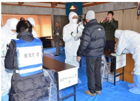
避難退域時検査(住民スクリーニング) (三春町運動公園談話室)