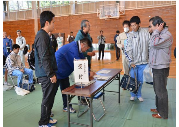
保護者引き渡し訓練 (小川中学校)