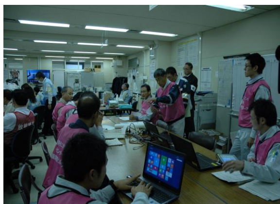
緊急時モニタリング訓練 (緊急時モニタリングセンター)