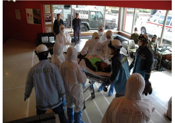
医療中継拠点(傷病者の搬送) (三春町民体育館)