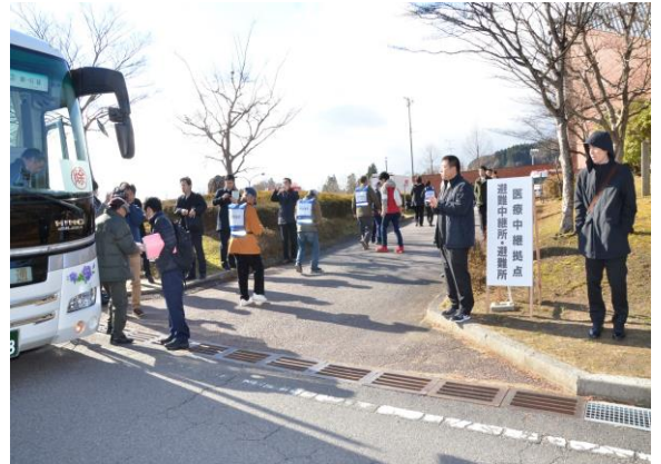
住民避難訓練(住民到着) (三春町民体育館)