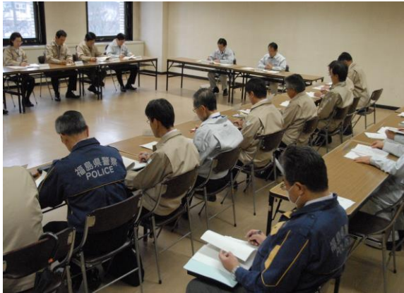
県災害対策本部員会議 (自治会館303会議室)