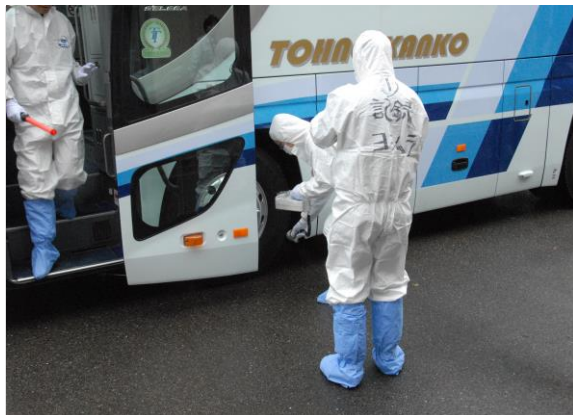
避難退域時検査(指定箇所検査) (やないづふれあい館)