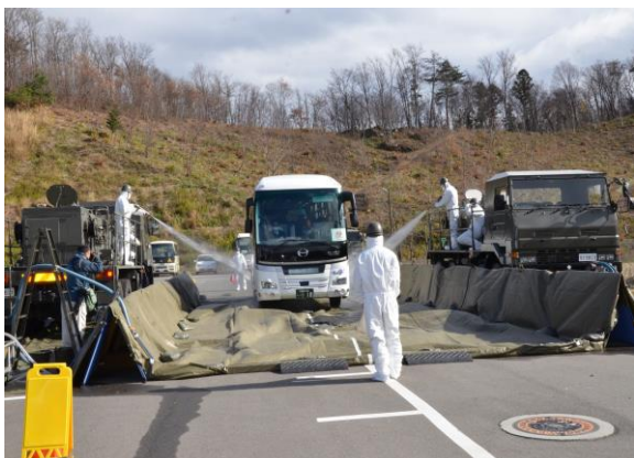
避難退域時検査(流水を用いた簡易除染) (三春町運動公園駐車場)