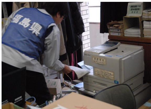
緊急時通信連絡訓練(事業者からの通報受信) (県災害対策本部)