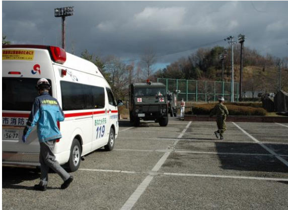
傷病者搬送(救急車両の到着) (三春町民体育館)