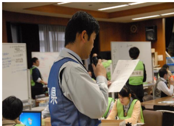
県災害対策本部設置運営訓練(情報共有) (県災害対策本部)