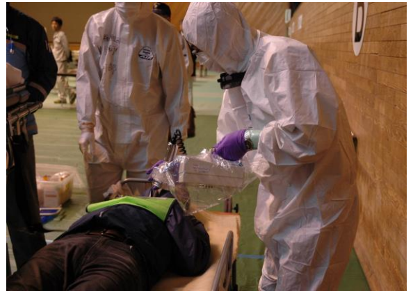
医療中継拠点(スクリーニング) (三春町民体育館)