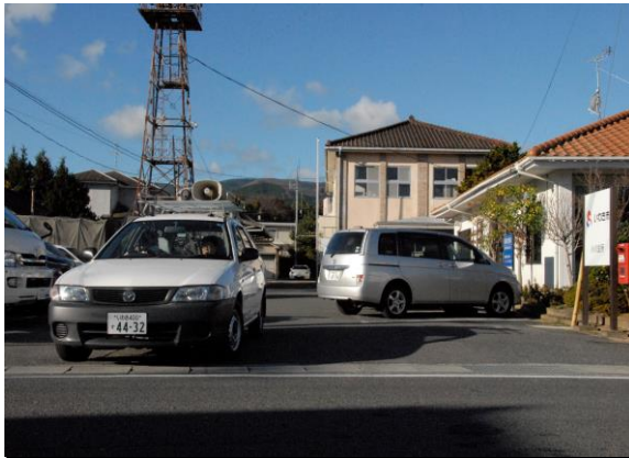
広報訓練(車両による住民広報) (いわき市役所小川支所)