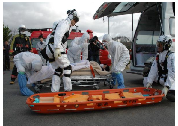
傷病者搬送(ヘリ移送) (三春町民体育館)