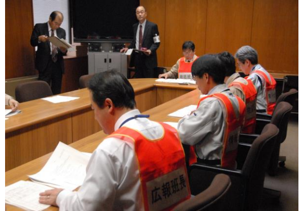
県災害対策本部班長会議 (自治会館特別会議室)