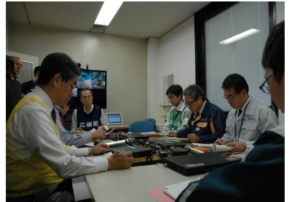
第1回原子力災害合同対策協議会 (原子力災害現地対策本部)