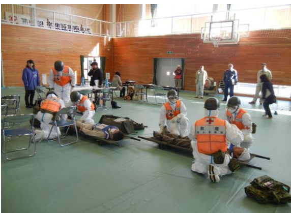
住民輸送訓練(傷病者搬送) (小川中学校)