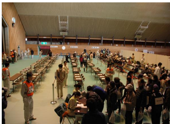
避難所(避難所への誘導) (三春町民体育館)