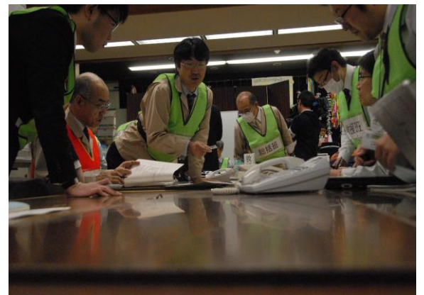
県災害対策本部設置運営訓練 (県災害対策本部)