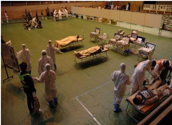
医療中継拠点(全体) (三春町民体育館)