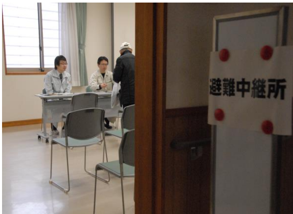
避難中継所(避難所への割り振り) (やないづふれあい館)