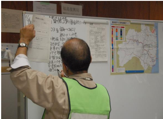
県災害対策本部設置運営訓練(記録) (県災害対策本部)