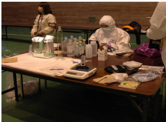
医療中継拠点(安定ヨウ素剤調合) (三春町民体育館)