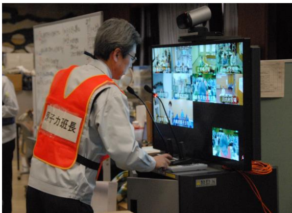
第1回原子力災害合同対策協議会 (県災害対策本部)