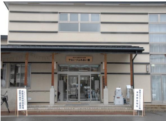
柳津町訓練会場(外観) (やないづふれあい館)