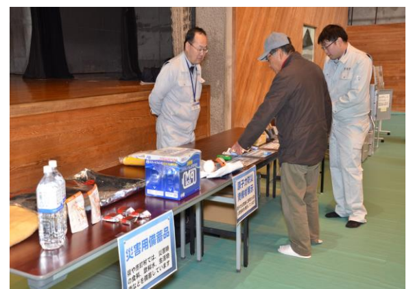
原子力防災資機材展示・説明 (三春町民体育館)