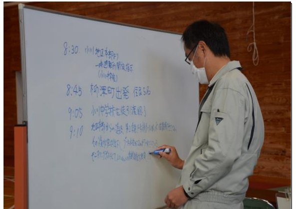
住民避難訓練(一時集合場所での情報提供) (小川中学校)