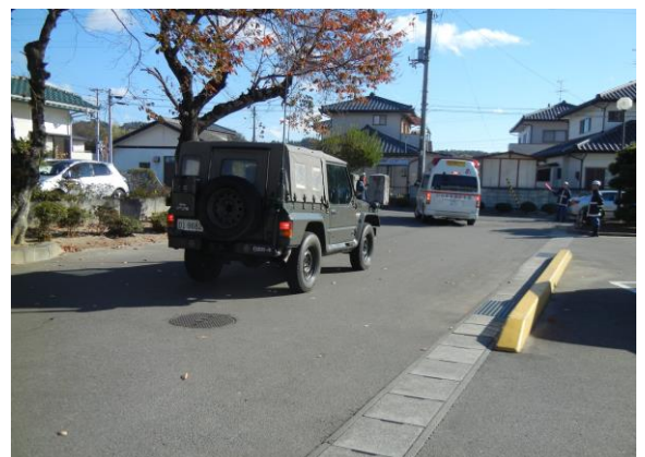
住民輸送訓練(救急車両) (小川中学校)