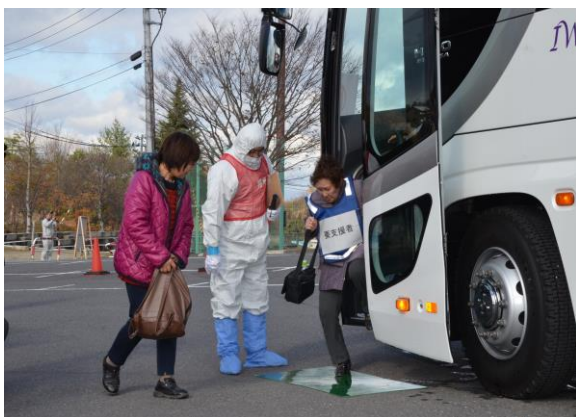
避難退域時検査(住民誘導) (三春町運動公園駐車場)