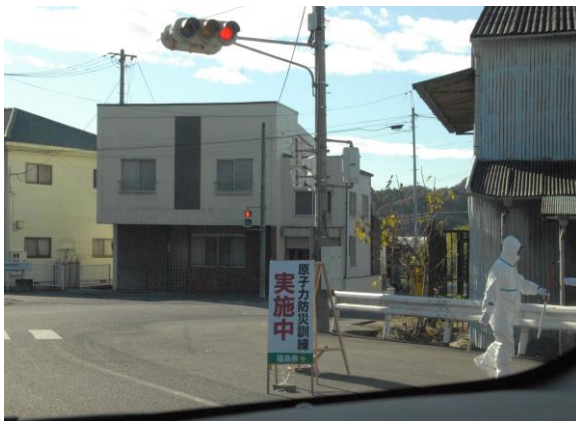
住民避難訓練(警察による車両規制) (いわき市小川町内)