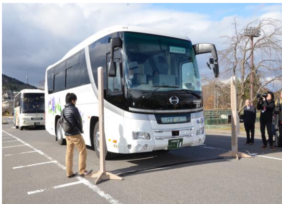
避難退域時検査(車両用ゲート型モニタ) (三春町運動公園駐車場)