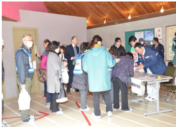
避難中継所(避難所への割り振り) (三春町民体育館)