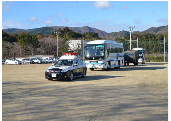
住民避難訓練(パトカーによる先導) (小川中学校)