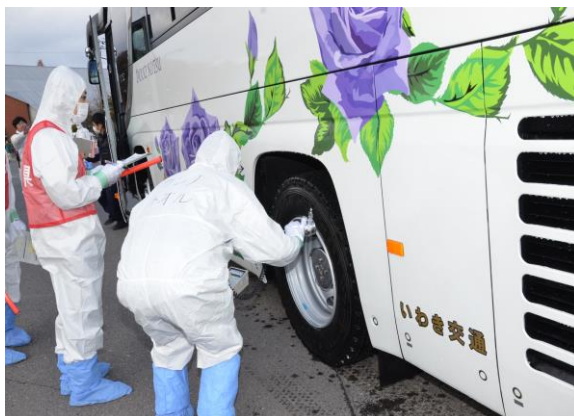
避難退域時検査(簡易除染後の検査) (三春町運動公園駐車場)