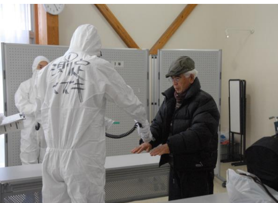
避難退域時検査(住民スクリーニング) (やないづふれあい館)