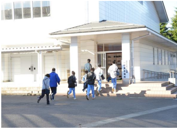
保護者引き渡し訓練 (小川中学校)