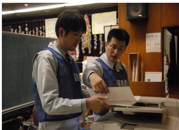
緊急時通信連絡訓練(FAX送信) (県災害対策本部)