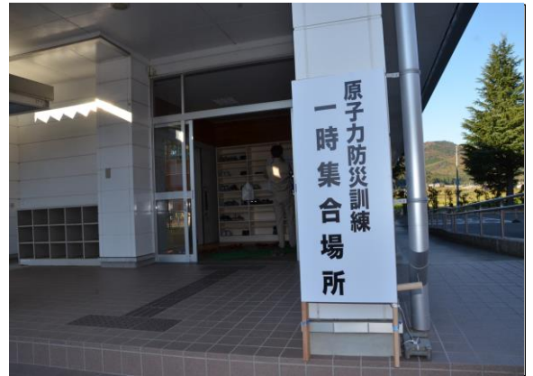
住民避難訓練(一時集合場所) (小川中学校)