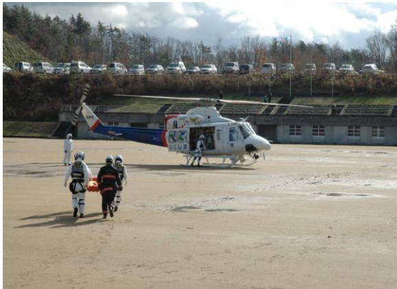
傷病者搬送(消防防災ヘリ) (三春町営グラウンド)