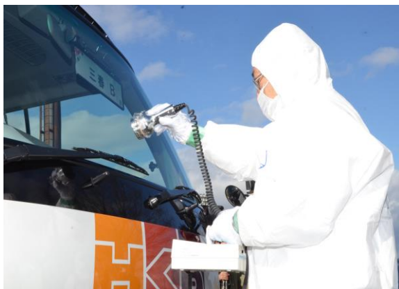
避難退域時検査(指定箇所検査) (三春町運動公園駐車場)