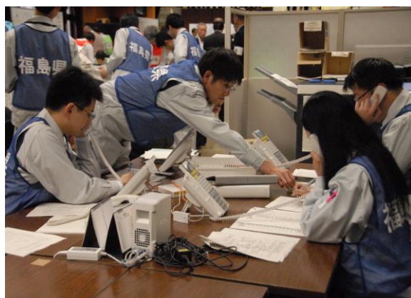
緊急時通信連絡訓練(電話による受信確認) (県災害対策本部)