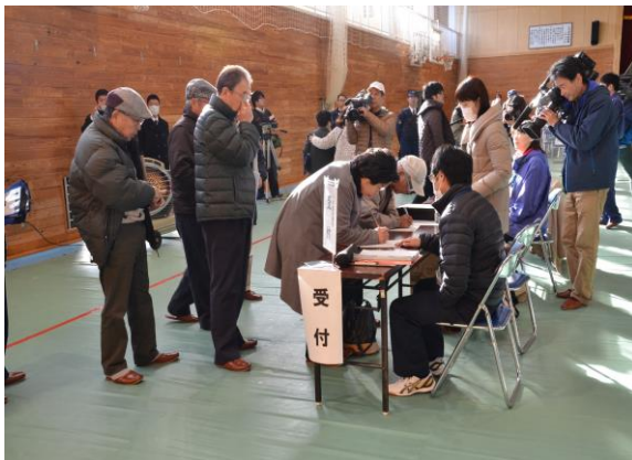
住民避難訓練(一時集合場所での受付) (小川中学校)