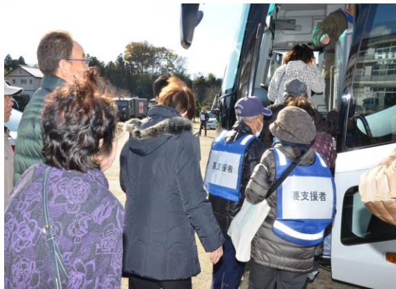
住民避難訓練(避難用バスによる避難) (小川中学校)