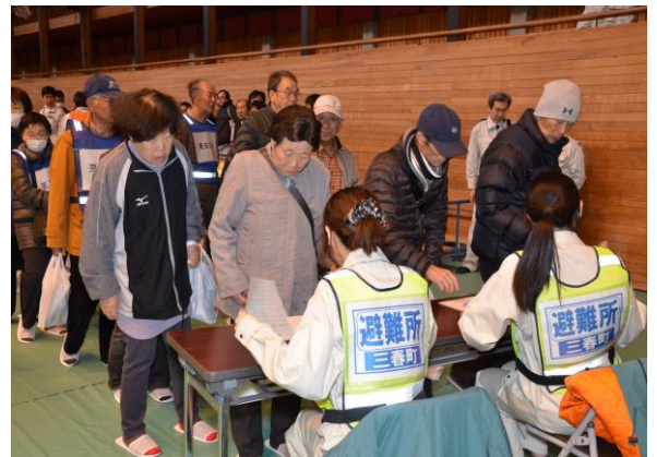
避難所(住民の受付) (三春町民体育館)