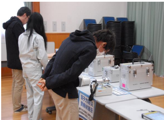
原子力防災資機材展示・説明 (やないづふれあい館)