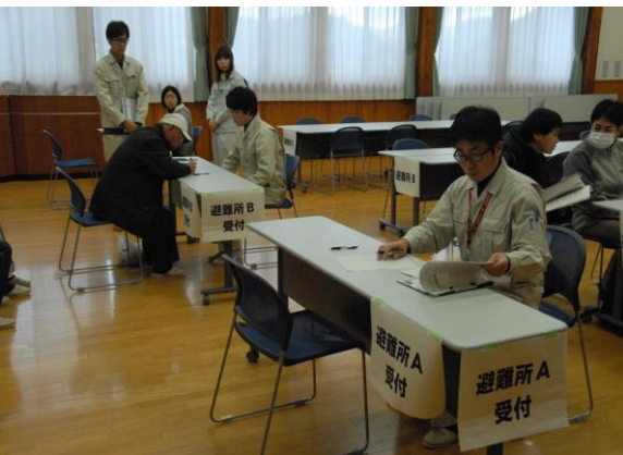
避難所(住民の受付、誘導) (やないづふれあい館)