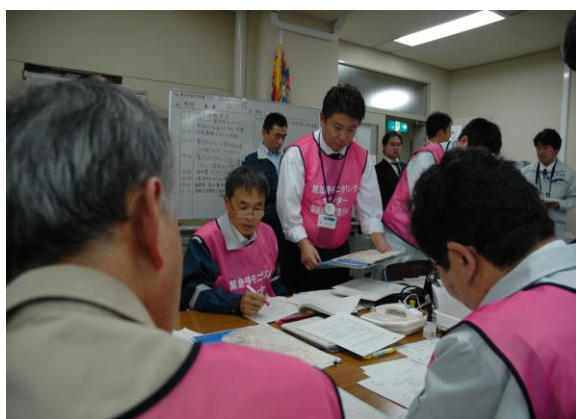
緊急時モニタリング訓練 (緊急時モニタリングセンター)