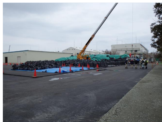
除去土壌等の積下ろし作業