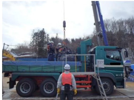
除去土壌等の積み込み作業