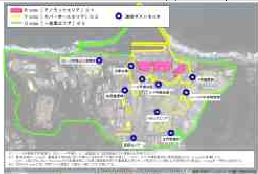
管理対象区域の運用区分 レイアウト