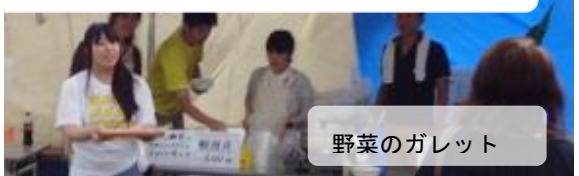
いわき農業青年クラブ連絡協議会(28日)