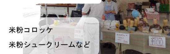
サークルつばさ(28日)