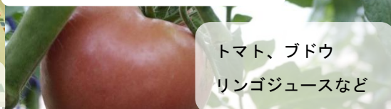
あいづ農業青年クラブ(28日)