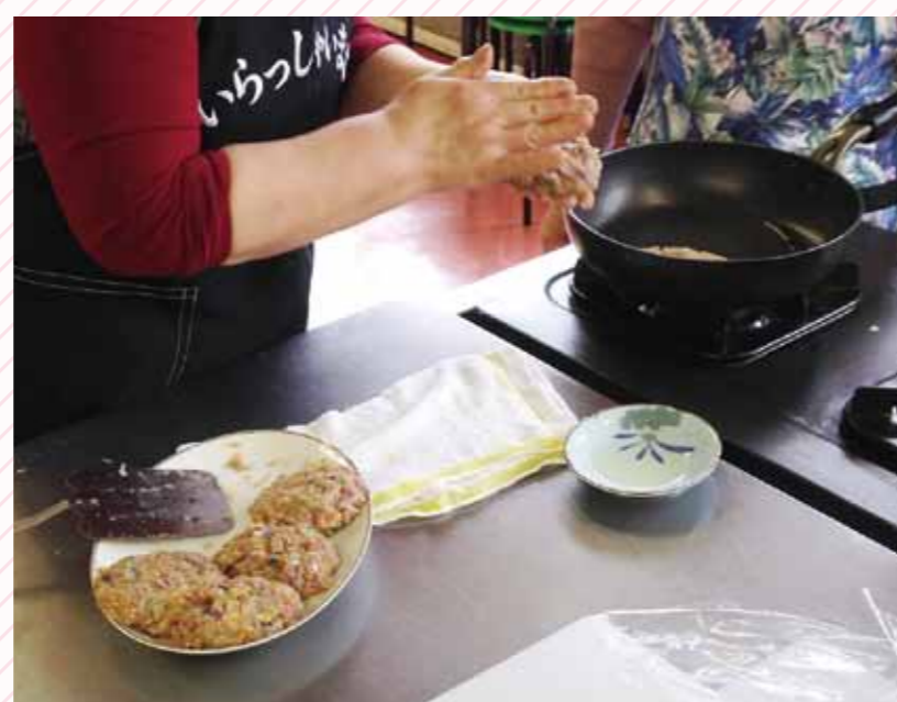
サンマの身をたたいてハンバーグ状に