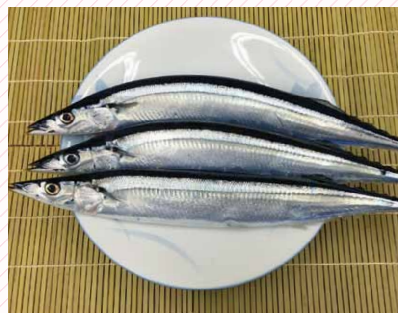
小名浜港の水揚げトップがサンマとカツオ