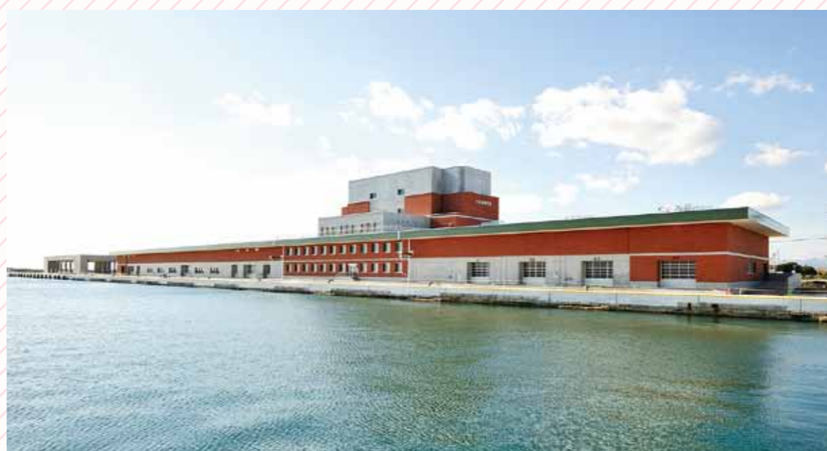
いわき市内には7つの漁港があります。

いわきの海は、親潮と黒潮が交わる、潮目の海。そこには多種多様な魚が群れ、格好の漁業エリアとして知られています。サンマのポーク焼きは、大漁時に漁師さんたちが船上で作ったメニューのひとつです。名の由来には、船内の煙突ストーブで焼く音から名づけられたという一説も。いわき市内の飲食店などで食べられる他、小売店による加工品の通信販売もされています。