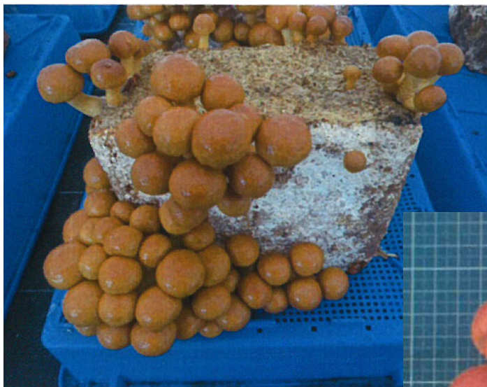
子実体発生 (11月中旬～12月下旬)