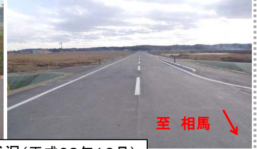
舗装工事の完了状況(平成28年12月)