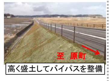
高く盛土してバイパスを整備