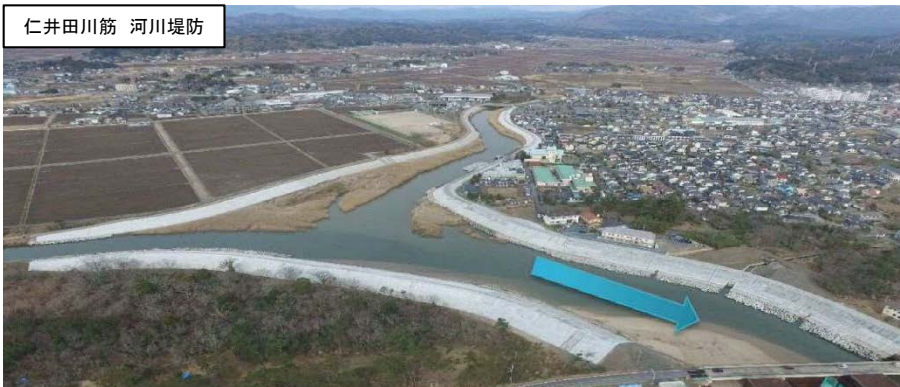
仁井田川筋 河川堤防

また、いわき市豊間地区の諏訪川河川堤防復旧工事、久之浜町末続地内の海岸・河川堤防復旧工事についても平成29年3月末に完成しました。