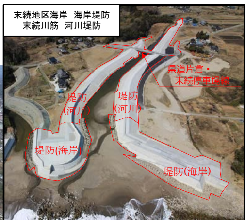
末続地区海岸 海岸堤防 末続川筋 河川堤防

この記事の問い合わせ先：いわき建設事務所 河川・海岸課 0246-35-6078