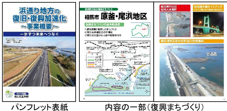
パンフレット表紙

ホームページにて公開しておりますので、下記アドレスからご覧下さい。 http://www.pref.fukushima.lg.jp/uploaded/attachment/210984.pdf