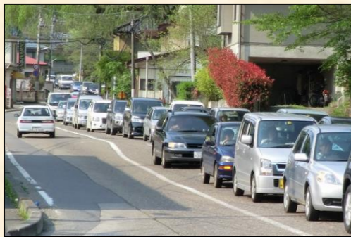
道路交通が集中し渋滞が頻発

市内での安全な通勤・通学や日常生活での利便性確保、観光客を招き入れての地域活性化、広域的で安定した物流などを実現するため、歴史ある街道筋を残しつつ新たな白河市内の骨格をなす道路として、白河市を南北に縦断する国道294号白河バイパスを平成30年代前半の供用開始を目指し整備しています。