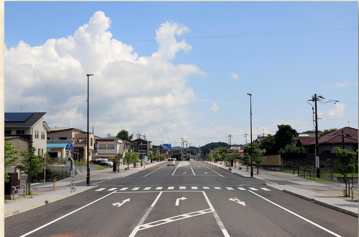
馬町工区(平成25年度供用開始)