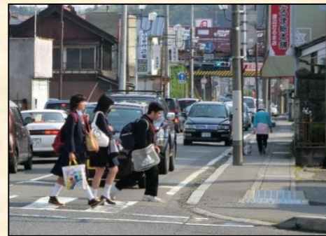
道幅が狭く歩行空間が不十分