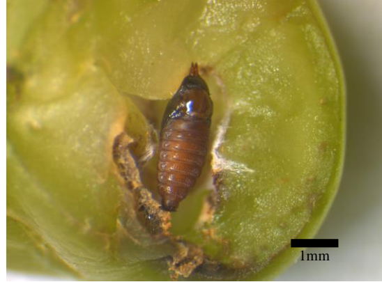
図2 ブドウミタマバエ蛹