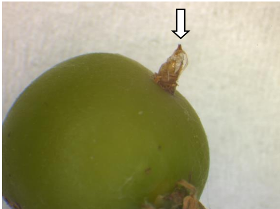
図3 ブドウミタマバエ蛹殻