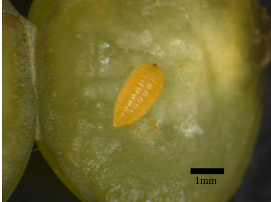
図1 ブドウミタマバエ3 齢幼虫