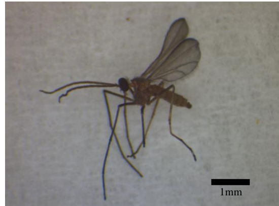
図4 ブドウミタマバエ成虫