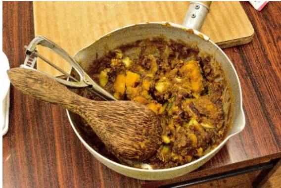
17 冬至かぼちゃを・・・