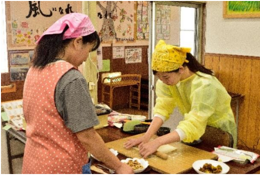
1 1 2日目も試作を重ね、改善して いきました。