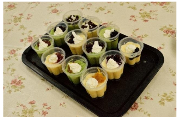
1 4 プリンの試作品