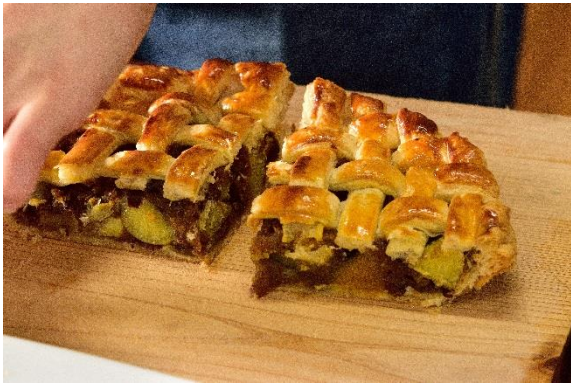
19 カットすれば、冬至かぼちゃが見えます！