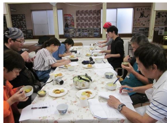
10 試食して意見交換