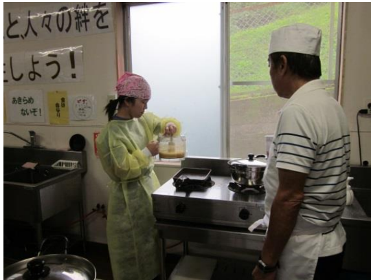
5 地元の方と一緒に試作していきます。