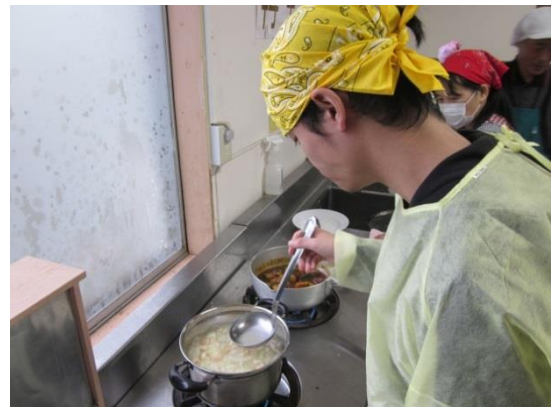
6 「おいしくできるかなあ・・・？」