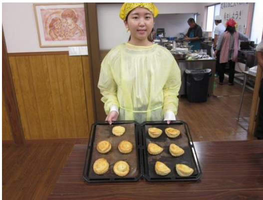
7 「試作品ができあがりました！」