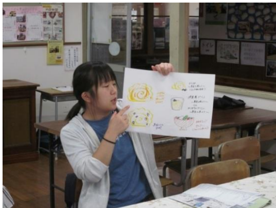
1 大学生から、新たな郷土料理のアイデアが出されました！

アイデアをさらに良いものに仕上げられるよう、レシピの助言等を受けながら、郷土料理やスイーツの試作を重ねていく予定です。