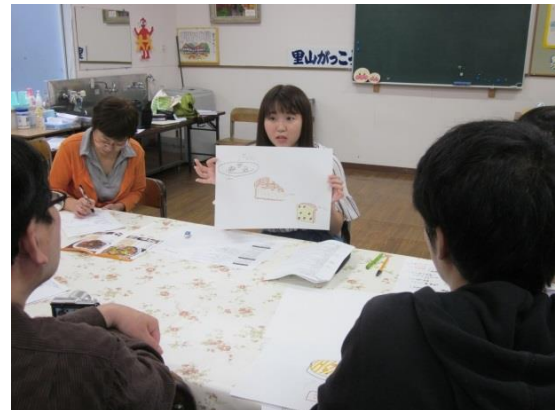
2 「こんな料理はどうでしょうか？」