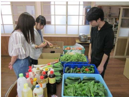
3 試作に使う野菜や果実を確認。 「全部、地元産ですか？どれも新鮮ですね！」