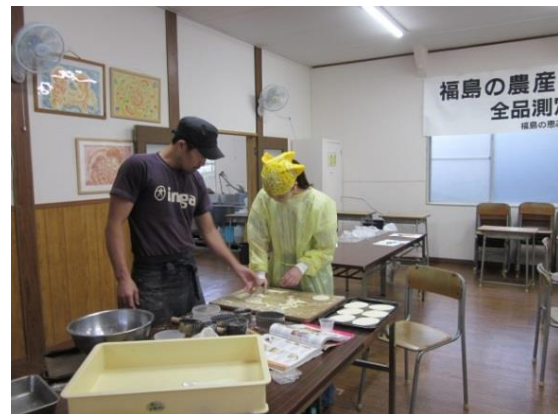
4 さっそく試作開始！