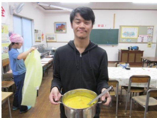
9 おいしくできたかな？！