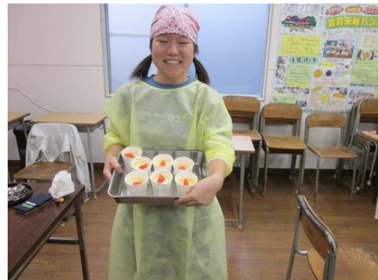
8 いつもの郷土料理とは違うものに仕上がりました。