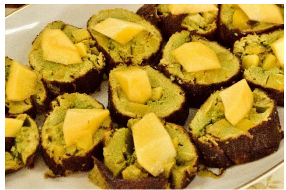
1 6 伊達巻きをアレンジした試作品 その2