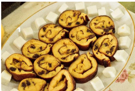
1 5 伊達巻きをアレンジした試作品 その1