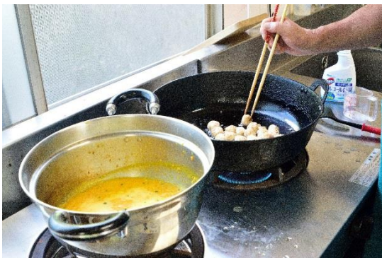
1 3 料理を仕上げていきました。