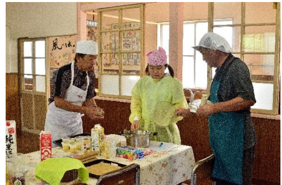
1 2 「こういう風に改善してはどう かな？」