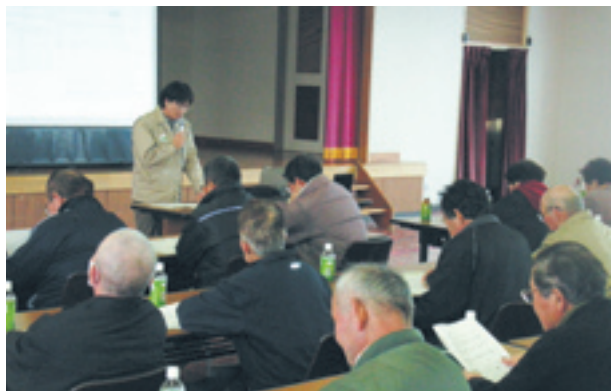
夏秋ネギ栽培指導会

今後、ブロックローテーションによる連作障害回避や、遊休農地の解消につながると期待されます。