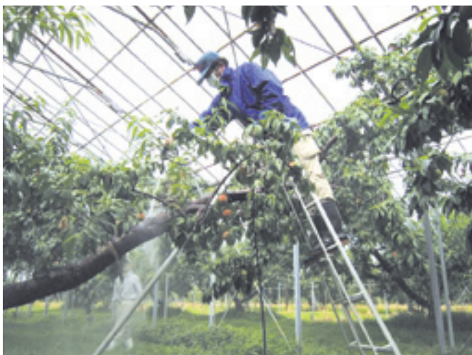
高圧洗浄機によるモモの除染作業

○樹皮の洗浄：粗皮が形成されにくい樹種（モモ、ウメ、ギンナンおよびリンゴ等の若木）では、高圧洗浄機を利用して樹皮を洗浄します。三春町のモモ園では、約50%の低減効果が確認されました（普及所調べ）。