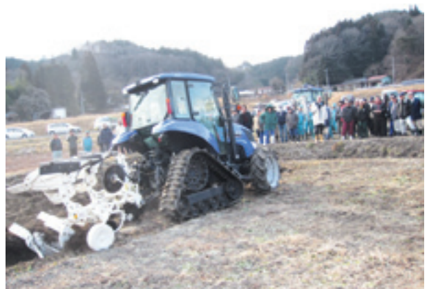
田村市で開催された反転耕実演会

いずれも多額の費用を要する大工事ですが、前者は削り取った土の保管場所が必要となるため、後者が採用されるケースが多くなると予想されます。