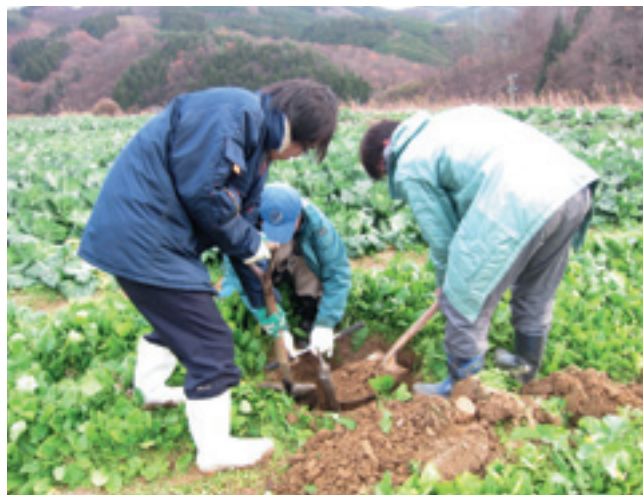
モニタリングのための土壌採取

このため、消費者や消費地に対する放射線低減対策に関する情報提供や、安全性を数値で示し、安全・安心をアピールするなどの取組対応が、販路拡大とともに農畜産物や産地の評価を高める上で、大切な取組になってくるものと考えられます。このような状況の中で、今後の農畜産物の生産に当たっては、放射性物質が検出されないことを目指した取組が重要となってきます。