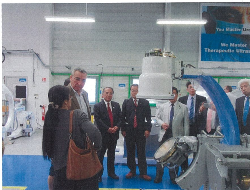
(エダップ社の社内を見学)

次に、2つ目の大きな働きとしては、クラスター間のマッチング。クラスターにもいろいろあるので、違ったタイプのクラスター、また同じ業態のクラスターの出会いというのをつくるといのも一つの大きな働きになっている。3つ目が、ロビー活動のような活動をサポートするというもの。