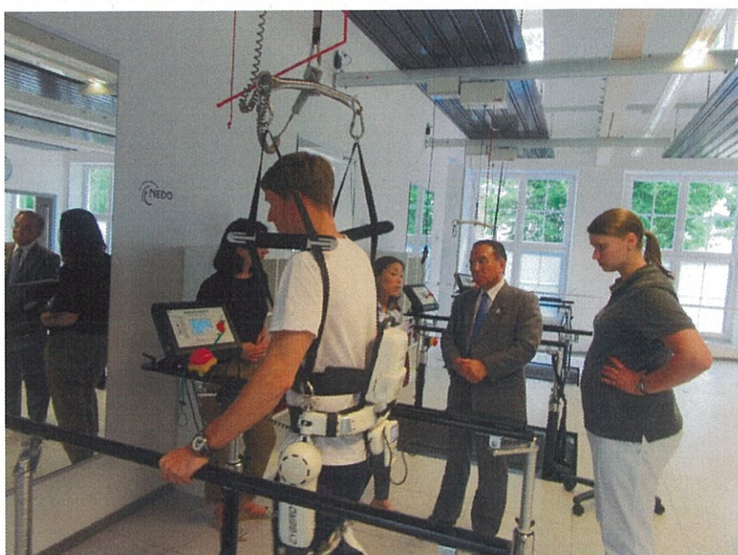
(ロボットスーツを利用した治療現場)