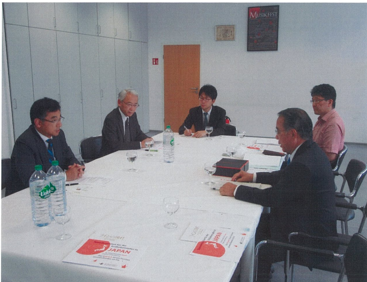
(デュッセルドルフ日本クラブにて)

○日本企業の活動等についての意見交換及び東日本大震災時の支援に対する御礼のために訪問。