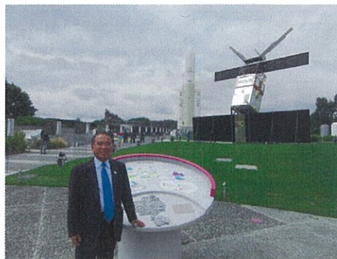
(シテ・ド・レスパス内)