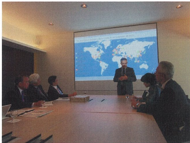
（エアバス社内で担当者より説明）