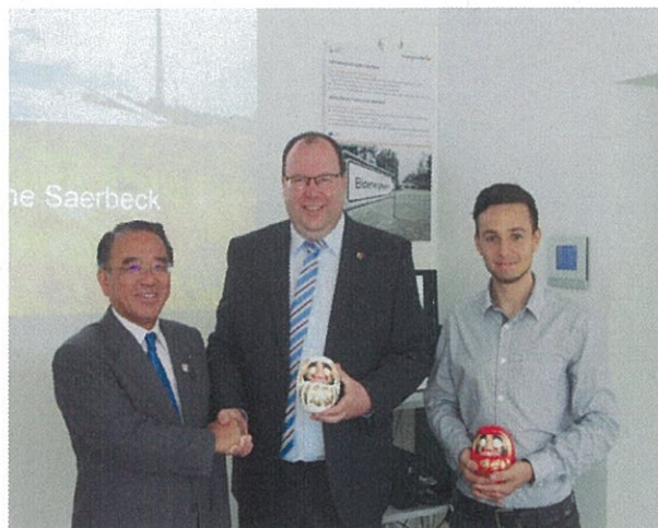
(ブッカー副町長(中央)と)