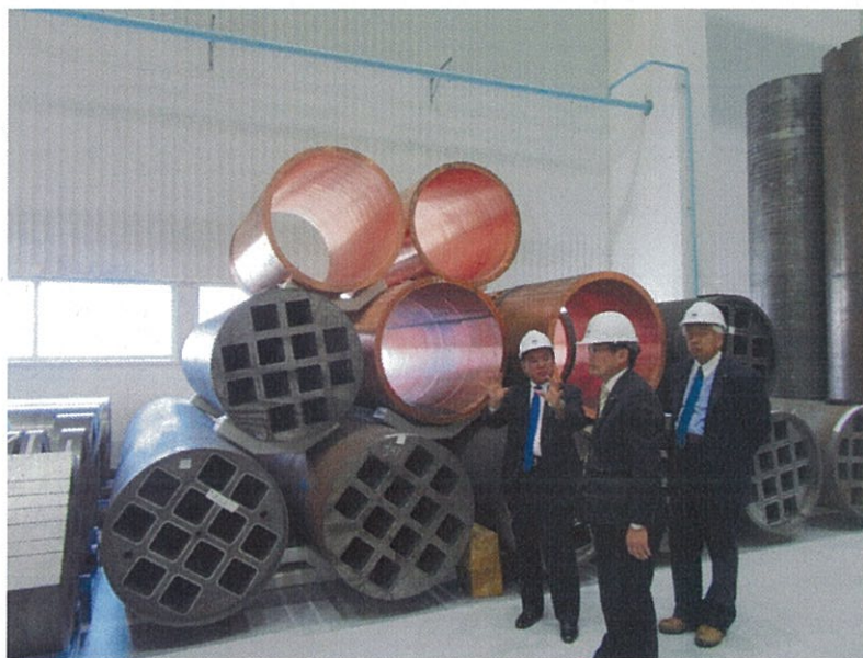
(キャニスタの実物容器)