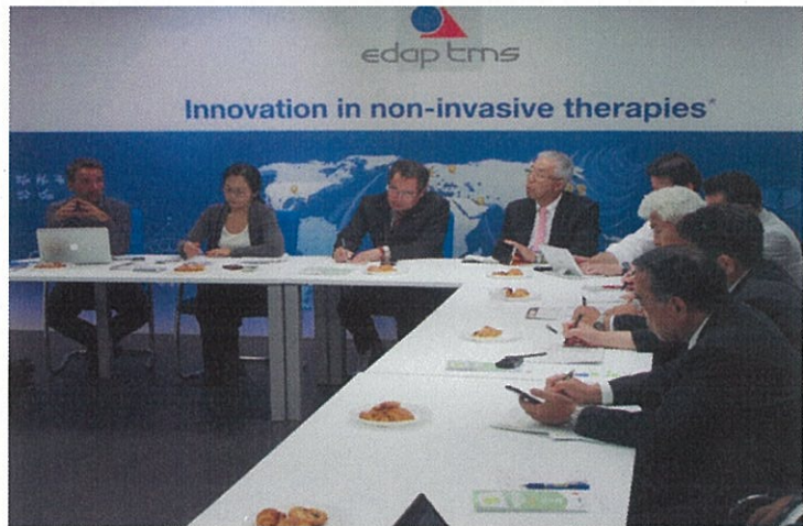
(I-CAREクラスターについて説明)